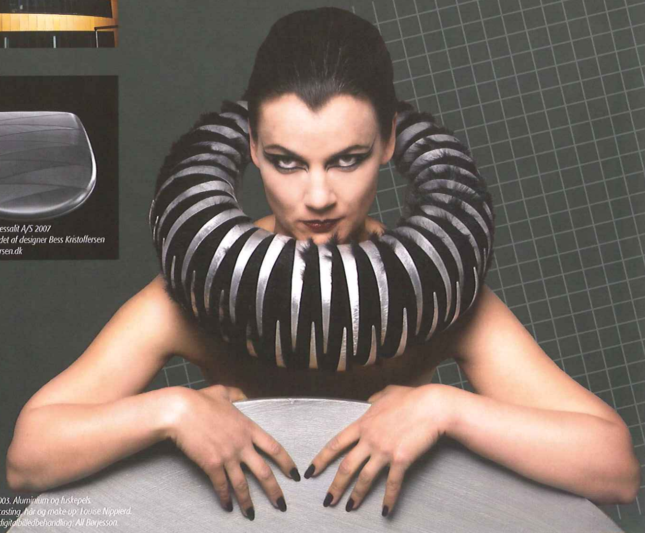
»Secret Sorrows« 2003. Aluminium og luskepels. Smykket, idé, regi, casting, hår og make-up: Louise Nippiert. Lyssetting, foto og digital billedbehandling: All Børjesson.

Man indfarver aluminiumsemnerne i den del af anodiseringsprocessen, hvor porerne stadig er "åbne".